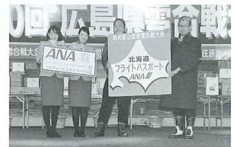
Pリーグ準優勝チームは、昭和南山国際雪合戦大会(北海道壮瞥町)へ！