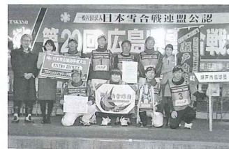
広島県大会の優勝チーム(Pリーグ及びレディースの部)は、日本雪合戦選手権大会(長野県白馬村)へ！