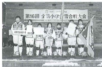
昨年度のジュニア優勝チーム